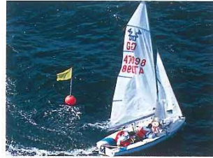
die Seite, die Segel killen und werden auf die andere Seite gezogen. Auf dem