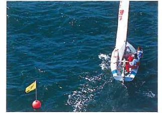
neuen Bug mit Wind von Steuerbord liegt die Strömung wieder an.

Der unerreichbare Sektor wird mittels Wendungen mehrfach durchquert, um das Ziel in Windrichtung, hier eine Boje, zu erreichen. Den Kurs zur Boje nennet man Kreuzkur: Das Boot kreuzt auf.