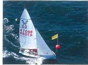
Das Boot kommt mit Wind von Backbord und viel Fahrt auf die Boje zu. Der