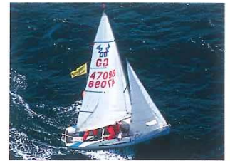
Steuermann luvt an und dreht den Bug in den Wind. Die Mannschaft wechselt